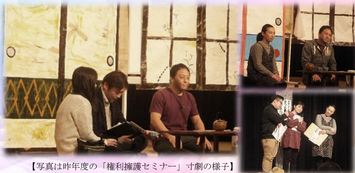
【写真は昨年度の「権利擁護セミナー」寸劇の様子】