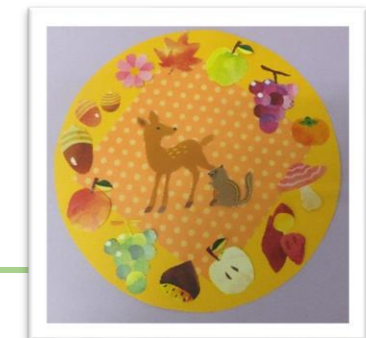
作品のイメージです