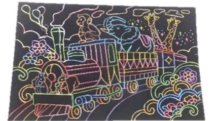
※ 写真はイメージです

※ スクラッチアートとは、台紙を削って楽しむ削り絵のことです。 塗り絵感覚で楽しむ事が出来ます(*^_^*)