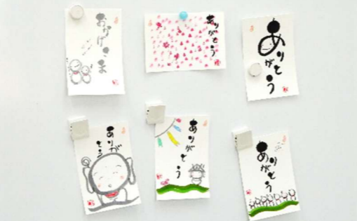
作品作りにほっこり癒されました♪(*_**)