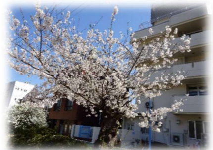
当日は天候にも恵まれ、絶好の花見日和！ 笑顔が広がる活動となりました😊